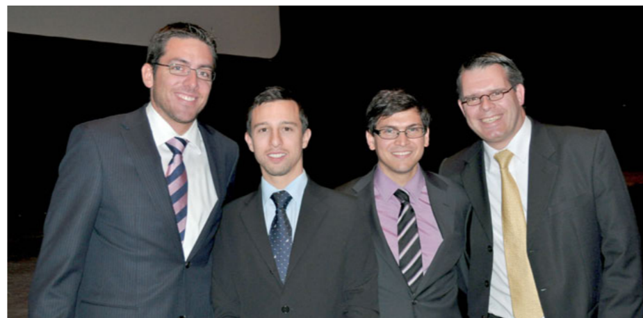
Les conférenciers du séminaire sur les Tableaux de Bord